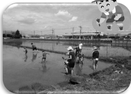
手植えを体験しました