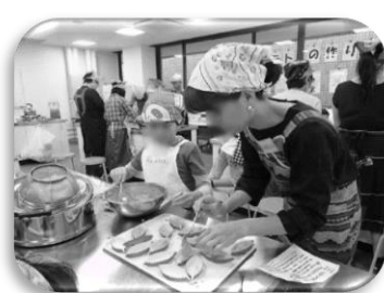
材料を型に詰めます