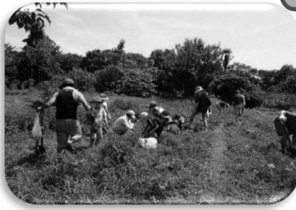
たくさんのじゃがいもを収穫しました