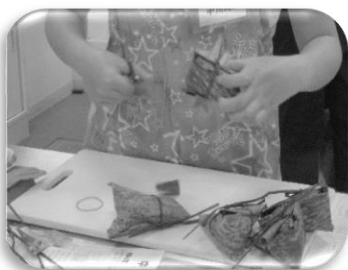
具材を竹の皮で包みます