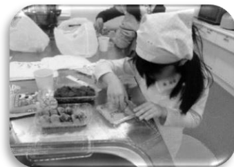
蒸しあがったよもぎだんごに、あんこやきなこをまぶします