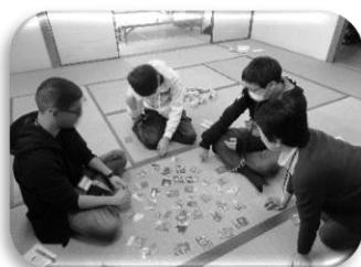
神奈川県のご当地かるたを楽しみました