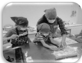
楽しい型抜き作業！